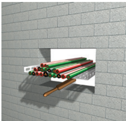
1. Почистете отвора.