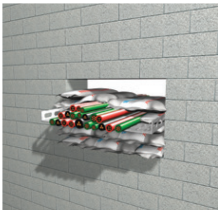
4. Покрийте кабелите и/или тръбите с пожарозащитните възглавници.