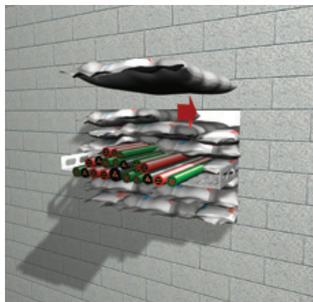
5. Затворете отвора с пожарозащитните възглавници, които трябва да бъдат поставени като тухли, с шахматно разположени вертикални фуги. Възглавниците трябва да са мушнати много плътно в отвора. Много важно е в него и около инсталациите да няма никакви отвори.