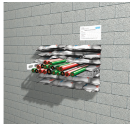
5. Поставете обозначителен етикет.

Продуктите трябва да се използват съгласно разпоредбите за строителните материали като цяло и в частност за продуктите за пожарозащита, едновременно с приложимите националните изпитвателни сертификати и одобрения и в съответствие с приложимите национални строителни наредби. С продуктите могат да работят единствено обучени професионалисти с необходимите знания и единствено след задълбочен преглед на ръководствата за монтаж, информационните листи за безопасност, националните сертификати от изпитвания и одобрения. За допълнителна информация относно как и къде да използвате този продукт, моля направете справка в ръководството на Promat или се свържете с местния офис на Promat. Всички необходими документи могат да се получат безплатно от местния офис на Promat. За страни извън Европейския съюз са на разположение отделни ръководства. Ако са ви необходими, моля свържете се с нас.