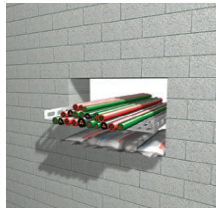
3. Първият слой възглавници трябва да се постави под кабелите и/или тръбите.