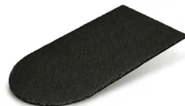
Kergoat Relief ronde